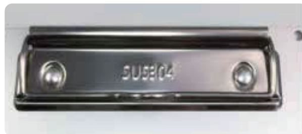
クリップパーツは錆び難いステンレス304製です

金属製なので検知器に反応し 破片混入等のリスクが軽減します。 1.5mm厚のアルミ板は安心感を持てます。