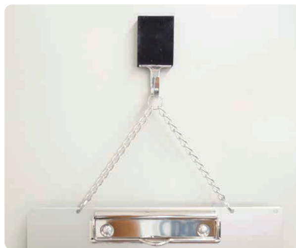
シリコンラバーマグネット + マンテルチェーンストラップ ※別売品