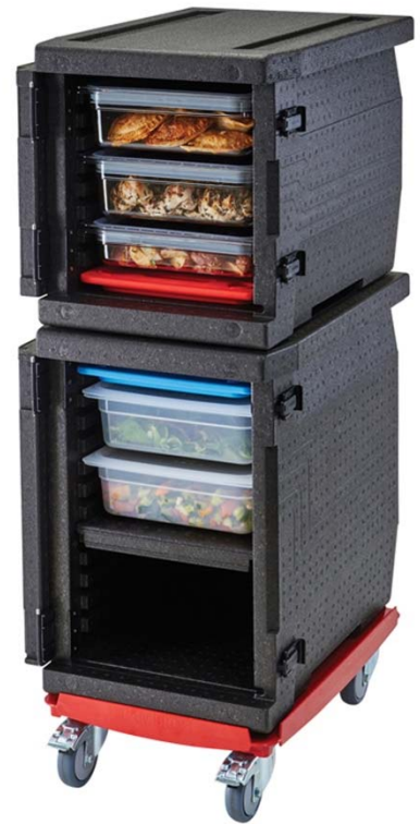
カムゴーボックス EPP300、EPP400 ドローリー CD3253EPP の組み合わせ