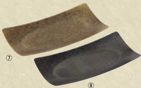
18-8 角型トレー ㊦