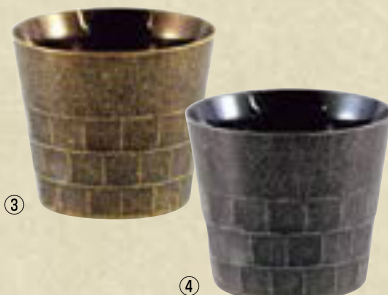
18-8 二重タンブラー オールド ㊦