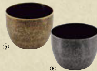
18-8 ぐい呑み (一重構造) ㊦