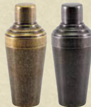
18-8 カクテルシェーカー ㊦