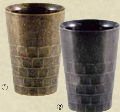
18-8 二重タンブラー S ㊦

古くから金属加工の街として発展、その技術を継承してきた燕市のステンレス加工技術。そのノウハウが込められた商品に、同じく燕市で発展した表面処理技術を施しました。