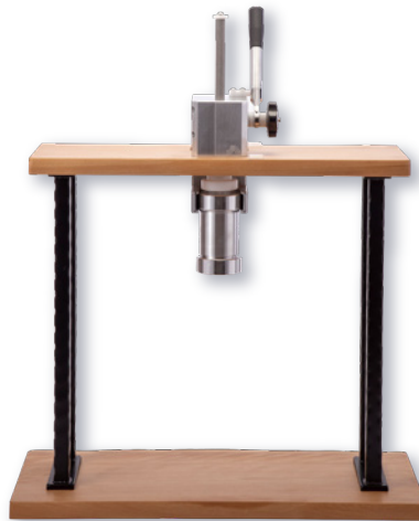
モンブランマシン (木枠モデル) ㊦

ページコード 商品コード 価格 3-1018-0701 2126930 ¥250,000 外寸:320×560×H635 枠H545 最大H810 材質:ステンレス、アルミニウム、樹脂 ●絞り部分は取り外し・分解洗浄が可能。衛生管理がし易く、絞りロプレートも付け替えが可能です。 ●基本付属品として、4枚のプレート(穴直径1.0mm×2種、1.5mm×2種)が含まれます。個別オーダー可能 ●大きなお皿でも使用可能です。 機構部のみ 3-1018-0702 2126960 ¥180,000 ㊦での販売