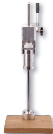
モンブランマシン (スリムモデル) ㊦

ページコード 商品コード 価格 3-1018-0801 2126940 ¥300,000 外寸:295×620×H655 枠H560 最大H825 材質:ステンレス、アルミニウム、樹脂、天然木 ●絞り部分は取り外し・分解洗浄が可能。衛生管理がし易く、絞りロプレートも付け替えが可能です。 ●基本付属品として、4枚のプレート(穴直径1.0mm×2種、1.5mm×3種)が含まれます。個別オーダー可能 ●大きなお皿でも使用可能です。