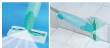
汚れに気づいたときにシュッとスプレーして拭き取りできます。