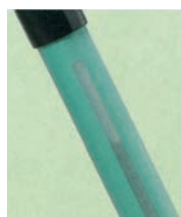
水や洗剤の残量が確認できます。

ハンドル:φ26×1,420 ホルダー:108×406 材質:ハンドル/アルミニウム ホルダー/ポリ塩化ビニール ●ハンドル内に水や洗剤を注入し必要時にハンドル上部のボタンを押すことで、床面に放出させながらの清掃が可能です。汚れが気になる箇所へは多めに水や洗剤をかけモップ清掃することで、効率よくしかも美しく作業できます。 ※専用モップは⑦、⑧よりお選びください。