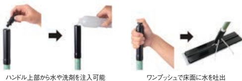
ハンドル上部から水や洗剤を注入可能

サイズ:100×100×H210 材質:ポリプロピレン、耐薬ABS ●3M水が出るモップツール専用のボトルパーツです。 ●一般的な床用洗剤、アルコール除菌剤、及び1,000ppm以下の次亜塩素酸ナトリウム水溶液などが使用可能です。 ●ボトルに薬液を入れて使用する際は、絶対にボトル内での薬液と混ぜないでください。