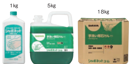
⑥ 手洗い石けん液 シャボネットユ・ム