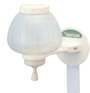
⑫ シャボネット石けん液容器 E型 接着剤タイプ

弱アルカリ性 使用量(目安):原液 成分:イソプロピルメチルフェノール、ジエタノールアミン、エデト酸塩 ●手肌にやさしいクリーミーな泡状石けん(専用ポンプ使用)で洗浄と同時に殺菌・消毒ができます。イランイラン&ラベンダーの天然精油の香り