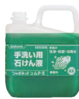
⑦ 手洗い石けん液 シャボネットユ・ム P-5 5kg

弱アルカリ性 無香料 使用量(目安):7~10倍希釈 成分:イソプロピルメチルフェノール、 エデト酸塩、緑色201号、緑色204号 ●手洗いと同時に殺菌・消毒