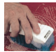
ハンドタイプの万能ブラシ