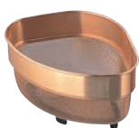
①ピュリティー 純銅 メッシュ 三角コーナー