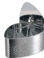
⑨抗菌ステンレス 圧縮蓋付 三角コーナー CK-115