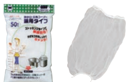
⑱水切りゴミ袋 ごみシャット 排水口・三角コーナー兼用 (50枚入) M-296