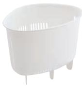
⑪H&H コーナーポケット ホワイト