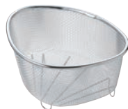
③18-8 三角コーナー 水きれ〜