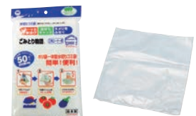
⑰水切りゴミ袋 ごみとり物語 BGW-250 三角コーナー用 (50枚入)