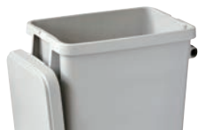
容器使用時にフタをハンドルに掛けて保持ができます

材質:本体・フタ/ポリプロピレン 排水栓/ポリエチレン キャスター/銅+エラストマー(自在×4、ストッパー2ヶ付)