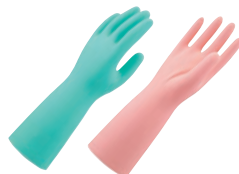
⑤ ショーワ ニトリルゴム製手袋 中厚手 No.139 加