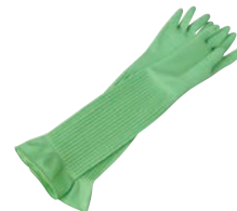
⑥ シンガー 天然ゴム厚手手袋 スーパーロング 加

材質:ニトリルゴム ●油・洗剤等に強い ●やわらかく使いやすい裏毛付 ●ラテックスアレルギーの元となるタンパク質を含んでいません。