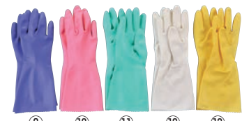
⑨ ⑩ ⑪ ⑫ ⑬ ビニール厚手手袋 ソフトエース 加

材質:表/天然ゴム、裏/ナイロン100% ●極細18ゲージ編手が柔らかく手にフィットします。 ●表面特殊処理加工によりグリップ性に優れています。