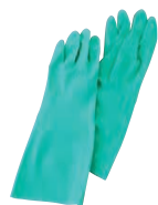
⑦ ニトリル手袋 ソルベックス 加