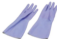
⑧ ダンロップ 手袋 デジハンド ソフト バイオレット

材質:ニトリルゴム ●化学的に強化した表面処理とエンボス状のすべり止め ●No.275のみ裏綿植毛付