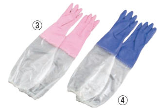
③ シルキー 厚手 手袋 腕カバー付

材質:塩化ビニール樹脂 ●抗菌防臭加工付き、手袋の表面に強力なすべり止め特殊加工がしてあります。