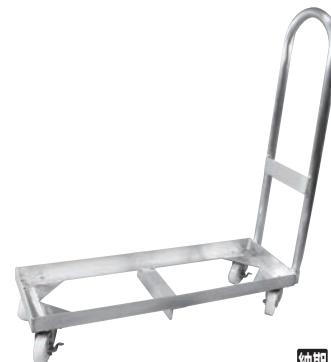
⑦アルミ製 一斗缶台車 H型 3缶用

260×260×H785 有効内寸:240×240×H105(φ275) 材質:ポリプロピレン、ハンドル/18-8 キャスター:ナイロン製 φ50 (自在×4、ストッパー2ヶ付) 最大積載荷重:60kg