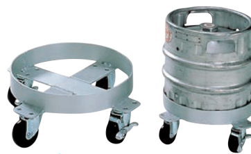
③アルミ 生樽用 台車

458×376×H125 有効内寸:452×370 材質:本体/ポリプロピレン アングル/アルミ キャスター:ナイロン製 φ50 (自在×4、ストッパー2ヶ付) 最大積載荷重:100kg