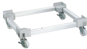
②ビールコンテナ用 台車 AP-No.20

385×470×H160 有効内寸:375×460×H60 キャスター:ナイロン製 φ75 (自在×4、ストッパー2ヶ付) キャスター耐荷重:約120kg ●瓶ビールケースに使用えます。