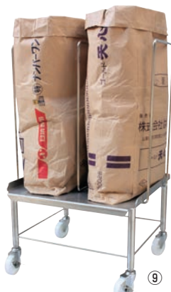
HACCP300オールステンレス袋キャリア