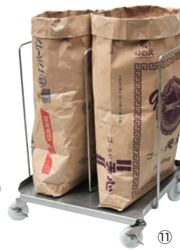
オールステンレス袋キャリア