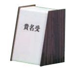
㉓ 木目 貴名受