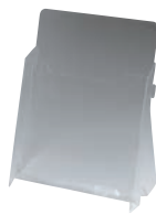
⑦ カタログホルダー A190 (B5判)