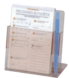
⑫ えいむ ハガキアンケート スタンド