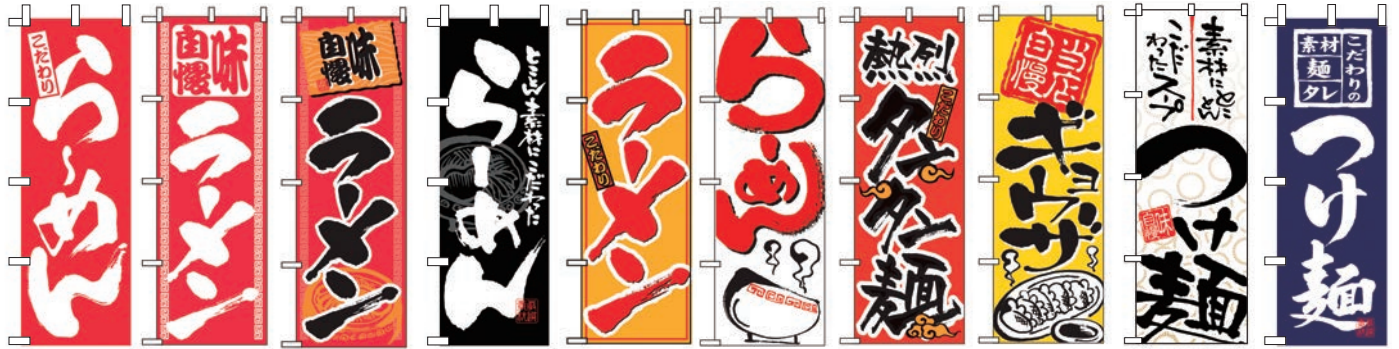
① ② ③ ④ ⑤ ⑥ ⑦ ⑧ ⑨ ⑩