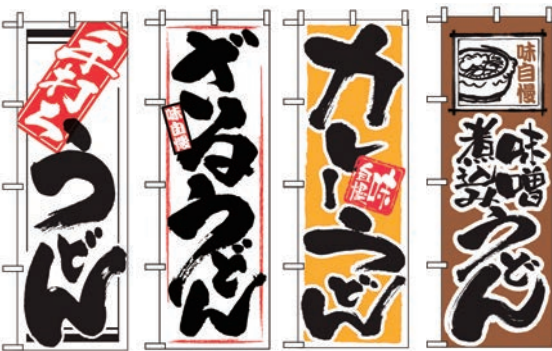
㉑ ㉒ ㉓ ㉔