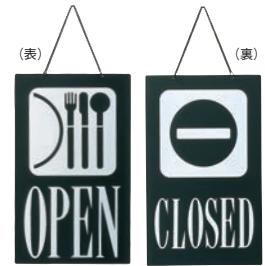
④ えいむ オープン・クローズプレート ブラック 加