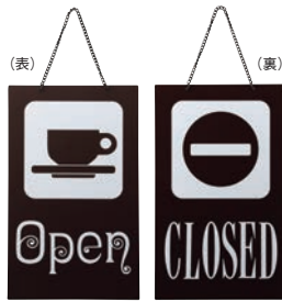
② えいむ オープン・クローズプレート ブラウン 加