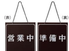
⑦ えいむ オープンプレート 営業中・準備中 茶 加