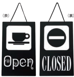
① えいむ オープン・クローズプレート ブラック 加