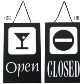
③ えいむ オープン・クローズプレート ブラック 加