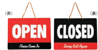
⑩ カナディアン オープンプレート 加