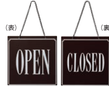
⑨ えいむ オープン・クローズプレート ブラウン 加