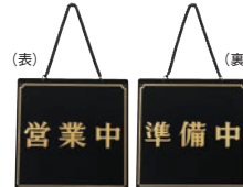
⑥ えいむ オープンプレート 営業中・準備中 黒 加