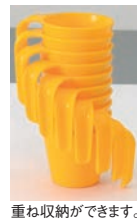
重ね収納ができます。