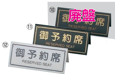
えいむ A型 予約席 RY-31