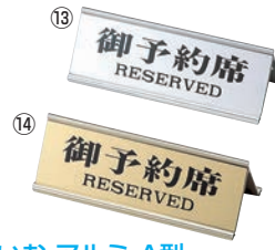
えいむ アルミ A型 予約席 RY-32J