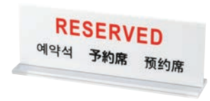
㉑多国語プレート 予約席