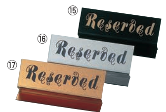
えいむ Z型 リザーブ RY-41