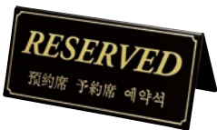
⑱シンビ 予約席 黒