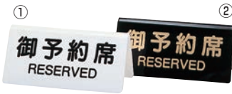
シンビ 予約席 DS-3