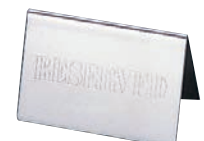
㉕UK 18-8 テーブルリザーブ カード