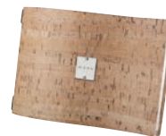
③ナチュラル (A4横) ㊦