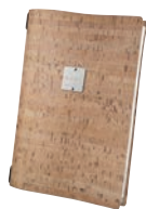
①ナチュラル (A4) ㊦