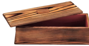
③焼杉 はし箱 (内朱)