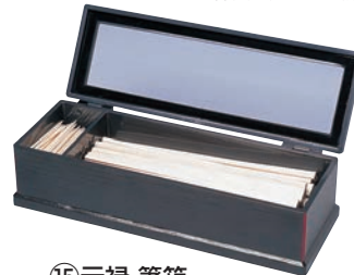
⑮元禄 箸箱 黒淵朱 (楊枝入付)