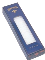
⑤ ローソク 小白 特大ダルマ (64本入) ㊦