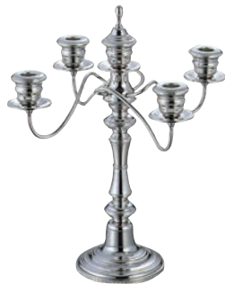
① UK 18-8 V型 キャンドルスタンド 5本立