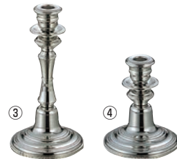
UK 18-8 V型 キャンドルスティック 1本立