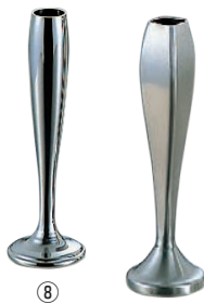
⑧ UK 18-8 砲弾型 フラワースタンド