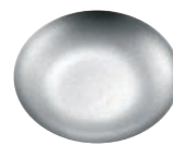
⑥ヴィンテージ 18-8 スモールトレイ 92