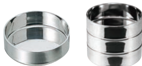
⑤18-8 シンプルトレイ (バターディッシュ兼用)