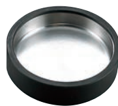
③ビート灰皿 小 (φ100) 丸型 (ゴム枠)