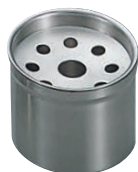
⑩18-8 筒型 灰皿 72