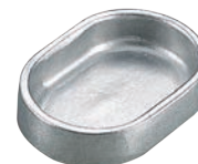
⑪アルミダイキャスト 灰皿 シルバー