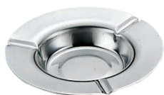
①EBM 18-0 平灰皿