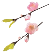
⑮飾り花 (100入) 梅 加