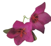
⑰飾り花 (100入) 桔梗 加