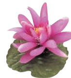
⑱飾り花 (100入) ハス 加