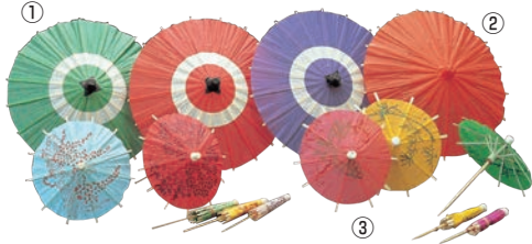
①蛇ノ目傘 B (100ヶ入) 加