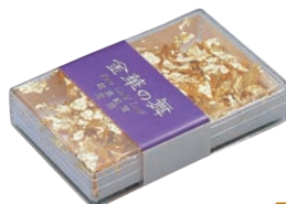
⑳金箔 64238 金華の舞 加 軽減税率