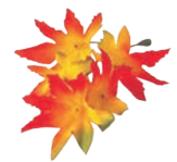
⑲飾り花 (100入) もみじ 加