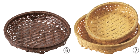
⑥ 樹脂オードブル 茶

Check! ⑥～⑪は ●竹製と同じように手作りで仕上げたので天然素材の風合いを残しています。 ●衛生面、耐久性に優れています。