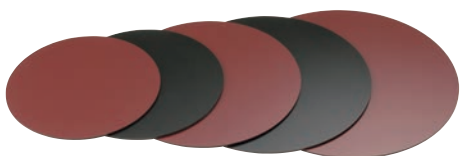
⑭ 樹脂 塗り板