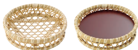
⑫ 樹脂 六ツ目オードブル 白