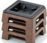
スタッキング可能です。