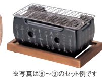
※写真は⑥～⑨のセット例です