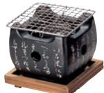
※写真は①～④のセット例です