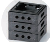
スタッキング可能です。