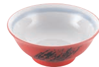
⑩赤軸筆流し高台丼 71