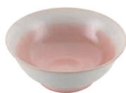
⑧釉彩ピンク高台丼 71