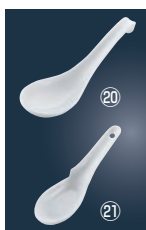
⑳白ラーメンレンゲ 71