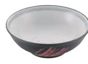
⑪黒軸筆流し玉淵丼 71