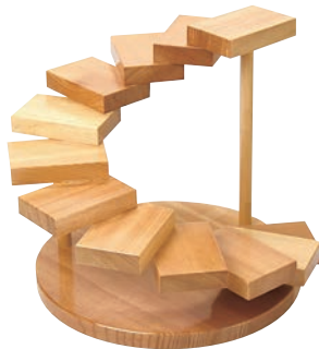
③螺旋(十二段) 35396 加直A