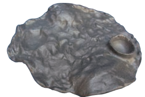
⑪月面プレート 黒砂 HO-358 加