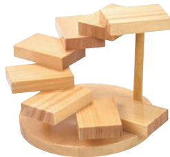
④螺旋(八段) 35397 加直A