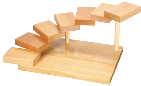
①段々(七段) 32360 加直A