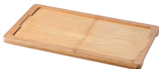
⑩バサルト レクタンギュラー プレートライナー 641792