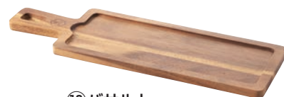
⑬バサルト レクタンギュラー ウッドボード 649182