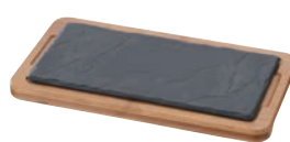
⑫バサルト レクタンギュラー プレートライナー 645200