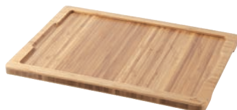
⑪バサルト ステーキプレートライナー 649188