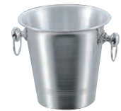
④アルミ シャンパンクーラー