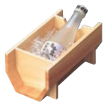
⑨白木 冷酒クーラー 12333 加