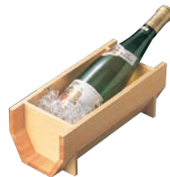
⑩白木 ワインクーラー 12334 加