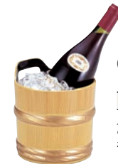
⑪桶ワインクーラー 白木帯金