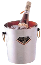
①18-0 パーティクーラー チャオ MR-310 加