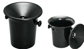
⑥スピittingL LC574BK 加

テーブルの縁に、テーブル板を挟み込むように設置するタイプなので、足下も省スペースでスッキリ。