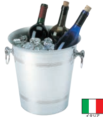
②アルミビッグ ワインクーラー 加