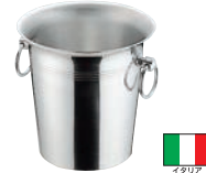
③アルミリング柄 ワインクーラー 加