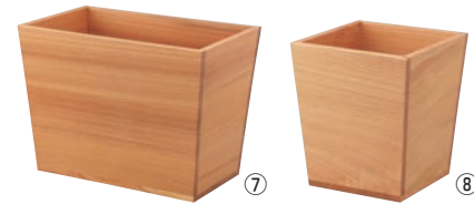
日光杉 ボトルクーラー 加