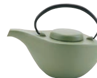
⑦南部鉄 急須 曳舟 若草艶消