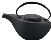
⑥南部鉄 急須 曳舟 黒艶消