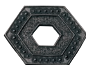
⑪南部鉄 釜敷 亀甲型