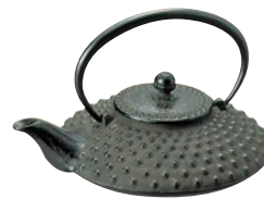
③南部鉄 爛瓶 平アラレ