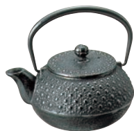
①南部鉄 急須 亀甲型