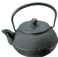
②南部鉄 急須 アラレ