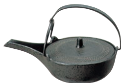
④南部鉄 爛瓶 平型