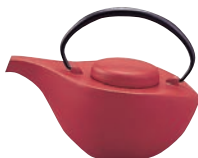
⑤南部鉄 急須 曳舟 赤茶艶消