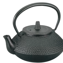
⑨IK 急須 宝山