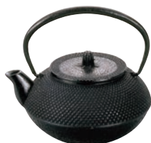
⑧アサヒ鉄 急須 丸アラレ