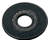
⑩南部鉄 釜敷 丸アラレ型