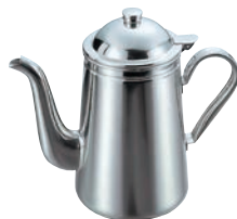
③EBM 18-8 蝶番付コーヒーポット