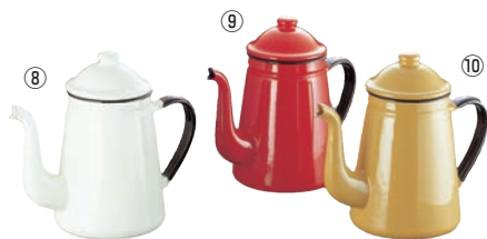
キリン印 ホロー コーヒーポット