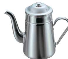
⑤18-8 コーヒーポット 太口