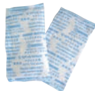
⑨ モーリアン ヒートパック

⚠ ※⑥～⑦の液体燃料はアルコール燃料ではありませんのでアルコールランプには使用しないでください。