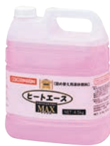
⑥ ヒートエースマックス 詰替専用 液体燃料 4ℓ