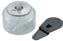
① ヒートエースα スタンダード 6H

③ 専用漏斗を使って燃料を補充します。(補充キャップをお使いいただくと便利です。)