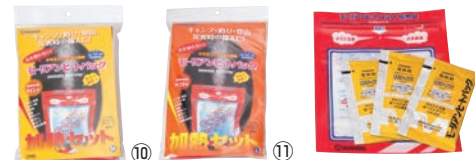
モーリアン ヒートパック ハイパワー 加熱セット