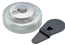
② ヒートエースα スタンダード ロータイプ