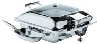
①スマートチューフィング 角型 (ガラス蓋仕様)

■電磁調理器対応だから温度の微調整が可能 ■プッシュボタンでフードパンの差し替えが簡単です。