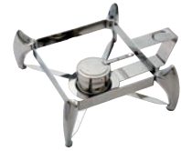
③スマートチューフィング 固形燃料用スタンド 角型

W400×D445×H200 (フードパン)内径355×327×H66 5.5ℓ 材質:18-10 ※サーバスプーンは別売