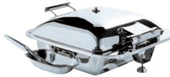
②スマートチューフィング 角型 (ステンレス蓋仕様)

W400×D445×H194 (フードパン)内径355×327×H66 5.5ℓ 材質:18-10 ●中がみえて曇らない強化硝子カバー ※サーバスプーンは別売