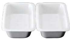
④スマートチューフィング 専用陶器 角型1/2セット 2分割 (2枚組)