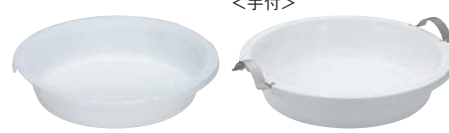
⑧UK アルミニウム IH丸フードパン