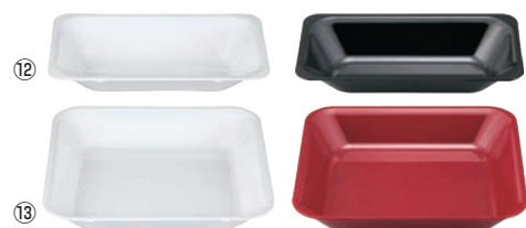
メラミン フードパン