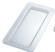
③コールドフェストフードパン用フラットカバー