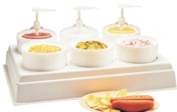
⑱コンジメントオーガナイザー