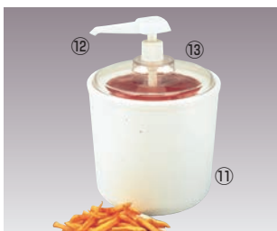
⑪コールドクロック