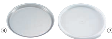
コールドフェストクロックカバー