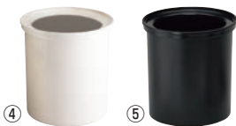
コールドフェスト ラウンドクロック CFR18