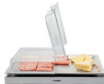
カバー適合表をご参照ください。