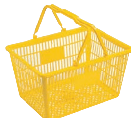
④買物カゴ MY-24 切