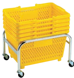
⑫スーパー籠用台車 大用 切