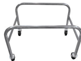
⑭ショッピングバスケット 置き台車 切