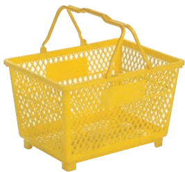
①サンコー スーパー籠大 切