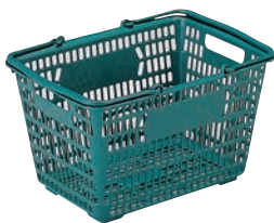
②サンショップカーゴ 101791 グリーン 切