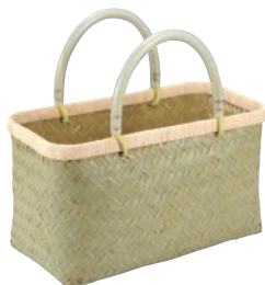
⑪青竹 市場かご ビニール取っ手 切

●おしゃれなデザインのハンドル付きバスケットです。折りたためるので、使用しないときはコンパクトに疊むことができます。おもちゃや衣類、食料品の収納やレジャー時の荷物入れなど幅広くお使いいただけます。