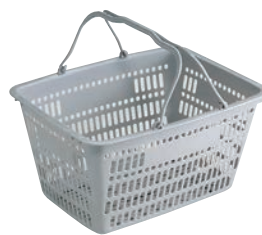
③サンコー サンショップカーゴ 切