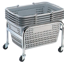
⑬サンショップカーゴ用 台車 切