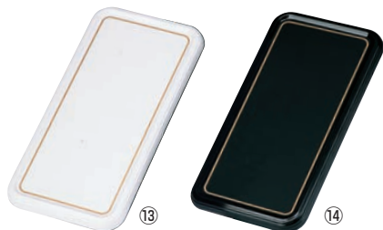
メラミン陶器風 ケーキトレイ