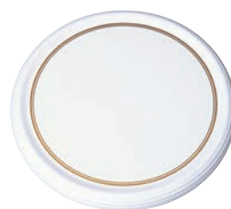
⑮メラミン陶器風ケーキトレイ