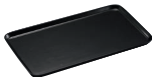
①陶磁器 角ケーキプレート