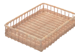
③籐製 大型パンカゴ ㊦