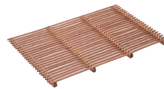
⑥籐製 スカシスノコ 茶