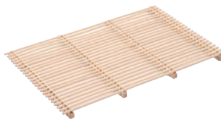
⑤籐製 スカシスノコ