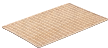
④籐製 パンスノコ ㊦