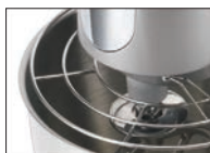
フィンガーガードがついているので指が巻き込まれにくい構造です。