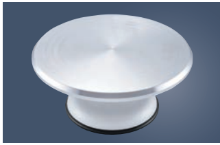
①アルミ鋳物 デコ回転台 4157