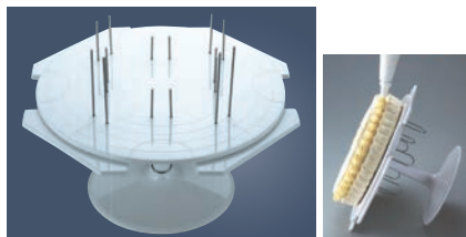
⑨PC デコレーション スタンド (ピン付) No.1325