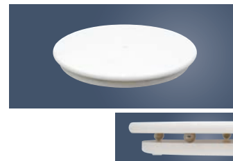
⑩人工大理石 回転台

外寸:φ310×H140 材質:本体/ABS樹脂、Uピン/18-8ステンレス ●ケーキ側面のデコレーションがきれいにできます。 ●スタンド式なのでケーキを置く位置が高く、デコレーションしやすいです。