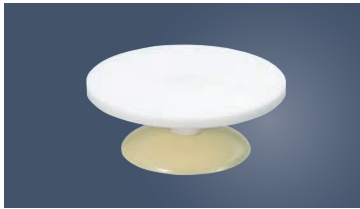
④ジュラコン 回転台