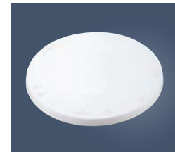
⑧PC トラクタ クールスタンド (回転台) No.1732 小