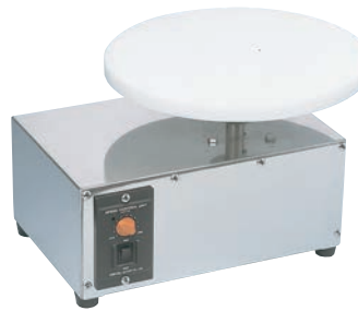
⑤電動 ジュラコン 回転台

ネジが支柱の凹にハマリ、天板を持ってもスタンド部がはずれません。(30cmのみ) ※あまり強く締めると回転が悪くなります。