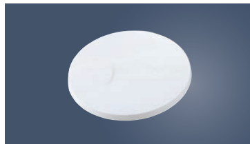
⑦PC クールスタンド (回転台)