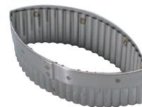
③ 18-10 手無 木の葉ギザ 抜型