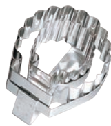
⑫ マトファー コキール 抜型 79894