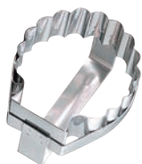
⑪ マトファー コキール 抜型 79893