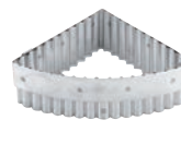
⑮ マトファー サブレギザ 抜型 79891