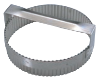
① 18-10 手付 丸ギザ 抜型