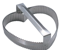
④ 18-10 手付 ハートギザ 抜型