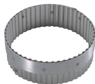
② 18-10 手無 丸ギザ 抜型