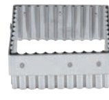
⑭ マトファー 角ギザ 抜型 79652