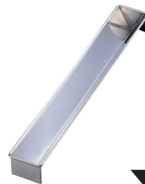
⑩18-0 羊かん トヨ型 三角