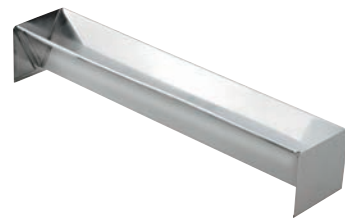
⑱ KM 18-8 トヨ型 V型