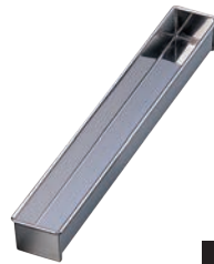
⑨18-0 羊かん トヨ型 角型