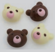
⑥シリコン チョコレートモールド くま SIG-59 ㊦