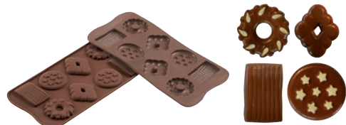
⑪ビスケット SCG25 (8ヶ取)