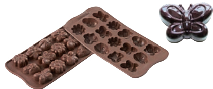
⑩チョコスプリングライフ SCG24 (15ヶ取)