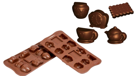
⑦ティータイム SCG17 (12ヶ取)