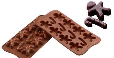
④ミスタージンジャー SCG12 (12ヶ取)