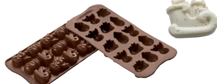
⑨チョコウインター SCG23 (15ヶ取)