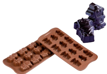
⑧ロボット SCG18 (12ヶ取)