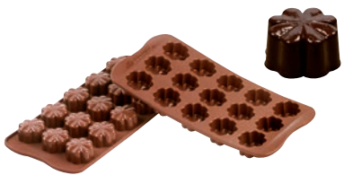
②フルーリー SCG08 (15ヶ取)