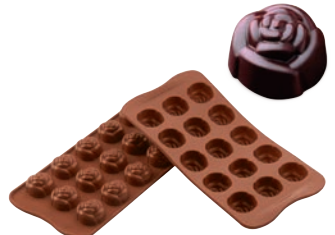
⑤ローズ SCG13 (15ヶ取)