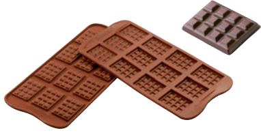
③タブレット SCG11 (12ヶ取)