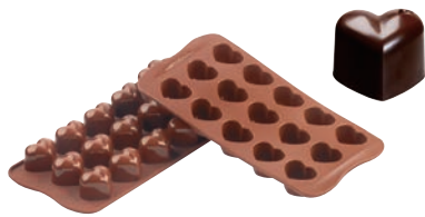
①モナムール SCG01 (15ヶ取)