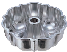
⑦ アルミダイキャスト ブディング型