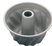
③ ブラックフィギュア クグロフ型