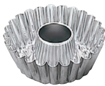
⑧ ステンレス 蛇の目型 No.535