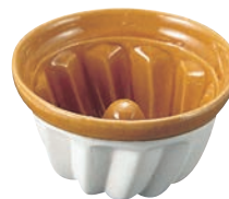
⑥ マトファー 陶器製 クーグロフ