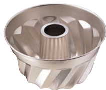
④ 18-8 クグロフ型 大