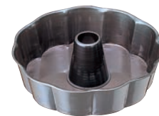
⑩ シリコン加工 ジャノメ