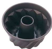
② トップブラックセラコン クグロフ型