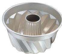
⑤ ギリア クグロフ型