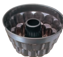
⑨ シリコン加工 二段菊