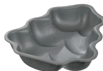
⑩ブラックフィギュア ケーキ焼型 もみの木 D-081

●熱伝導率はもちろんのこと、焼き上がりの「型抜け」もよく、お手入れのしやすい万能焼き型です。