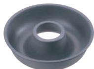
④アルプリット エンゼル型 18cm No.5253