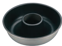
①EBM アルミ スーパーコート エンゼルケーキ型