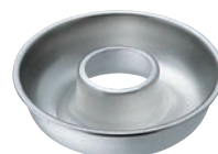
⑦18-8 エンゼルケーキ型