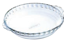
⑫ラウンドプレート 197BA00