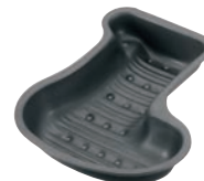
⑪ブラックフィギュア ケーキ焼型 プレゼントソックス D-082