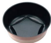
⑧マトファー スターマンケ 71460