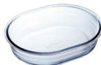
⑬オーバルプレート