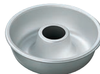
⑥アルミ エンゼルケーキ型