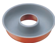
②トッピングオレンジ エンゼルケーキ型