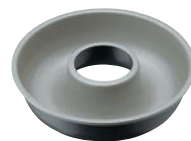
③ブラックフィギュア エンゼルケーキ型