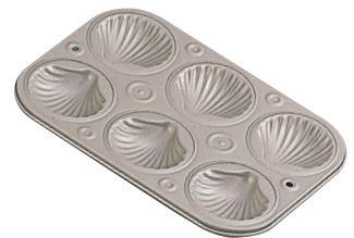
⑦マフィンパンケーキ型 シェル型