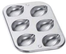
④ギルア マドレーヌ型 レモン型 6P No.918