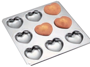
⑤ギルア マドレーヌ型 コックハート型 9P No.994