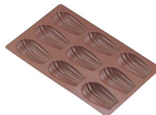
⑬シェル・マドレーヌ型 B-023