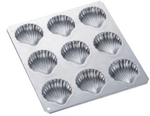
③ギルア マドレーヌ型 コックシェル型 9P No.999