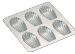
⑥パティシエール 18-8 シェル型 マドレーヌ PP-643