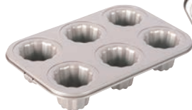
⑨フッ素加工 カヌレ天板