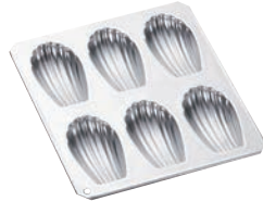
②ギルア マドレーヌ型 マドレーヌシェル型 6P No.987