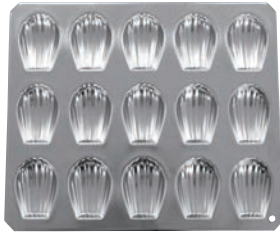
①ギルア マドレーヌ型 マドレーヌシェル型 15ヶ取 No.909