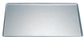
⑬ アルミ 角型 天板