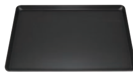
⑧ フッ素加工 ヨーロッパ軽量天板