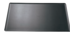
⑥ デバイヤー アルミ ノンスティック ベーキングトレイ