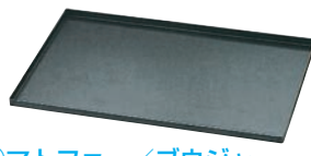
⑮ マトファー／ブウジャ ストレートエッジ ベーキングトレイ 4550.01