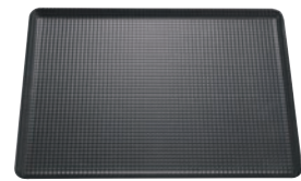
⑤ マトファー／ブウジャ オープン天板 (エンボス加工)