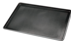
⑪ ノンスティック 穴あき欧州天板 GK1412