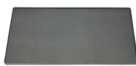
⑦ ノンスティック アルミ ベーキングシート 68088