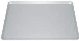
⑭ アルマイト加工 ヨーロッパ軽量天板