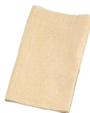
⑧ ホテイ印 綿 モチフキン (5枚入)