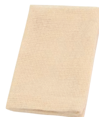
⑪ プロユーザーの蒸し器ネット