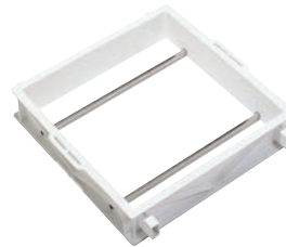
⑥ サンコー せいろう せいろう2型