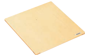
④ 抗菌角セイロ 平蓋