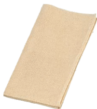
⑦ EBM 綿 モチフキン (5枚入) 苧