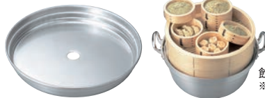
(半)寸銅鍋にも セットできます。