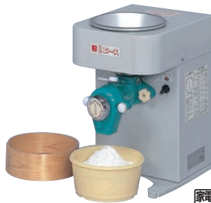
②卓上製粉機 粉エース A-8型

ページコード 商品コード 価格 6-0894-0101 6921100 ¥110,000 外寸:280×365×H540 ホッパー容量:4.8ℓ 電源:単相100V/250W(コンデンサー付) 重量:22kg 処理能力:乾燥生大豆7kg/時間 付属品:フレイ(60メッシュ)、工具、ブラシ ●ホッパーが大きく、材料を何度も追加する手間がいりません。