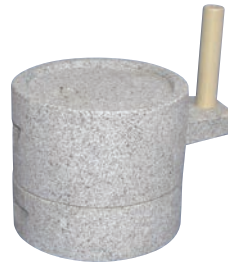
③みかげ石挽き臼 筒型 24型

ページコード 商品コード 価格 6-0894-0201 6921210 ¥76,000 外寸:225×320×H370 容量:1.2ℓ 電源:単相100V/100W 重量:12kg 処理能力:乾燥大豆2~3kg/時間 付属品:60メッシュ手フレイ、粉受容器、掃除ブラシ ※粉のキメはワンタッチハンドルで粗~細調節をします。