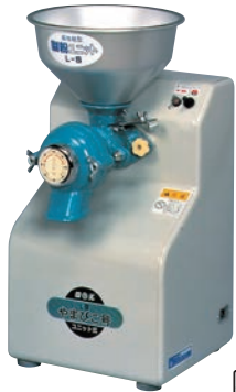
①製粉機 やまびこ号 L-S型

ページコード 商品コード 価格 6-0894-0101 6921100 ¥110,000 外寸:280×365×H540 ホッパー容量:4.8ℓ 電源:単相100V/250W(コンデンサー付) 重量:22kg 処理能力:乾燥生大豆7kg/時間 付属品:フレイ(60メッシュ)、工具、ブラシ ●ホッパーが大きく、材料を何度も追加する手間がいりません。