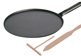
⑧ストウブ クレーパン 30cm 40509-526