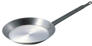
④SW 鉄 クレーパン