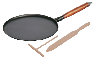
⑦ストウブ クレーパン 木柄 ブラック 28cm 40509-525