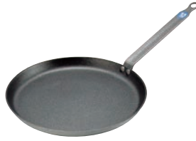
②ブウジャ アルミニウムスティック クレーパン 6661